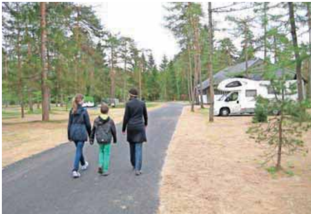
V nedeljo so kamp Šobec odprli za prve goste.

Ko so pospravili polomljeno drevje, so nadaljevali z ravnanjem terena in obnovo poti ter zasadili novo drevje.