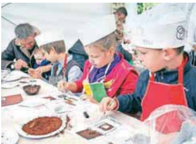
Otroci so vneto »packali« tudi v njim namenjenih delavnicah: ustvarjali so čokoladne čebelice, čokoladne vijake, čokoladne umetnije in čokoladne lizike.