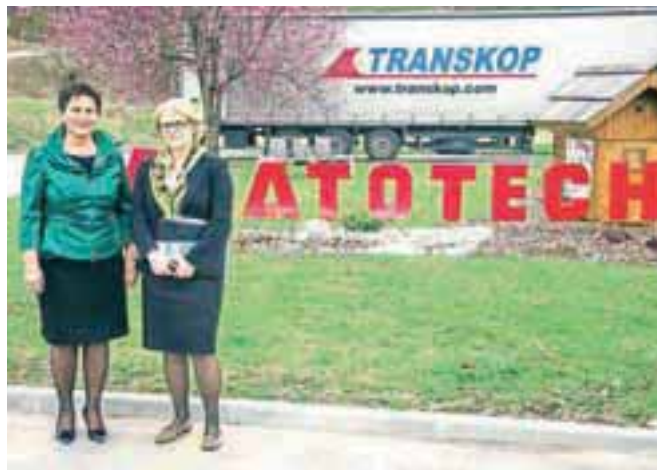
Ministrica za delo Anja Kopač Mrak je obiskala uspešno podjetje Atotech Slovenija.

Gradnja kanalizacijskega omrežja v Begunjah se je začela v letošnjem in bo končana v prihodnjem letu, vrednost del znaša 1,363 milijono evrov.