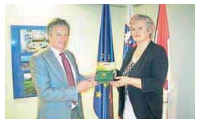
Že drugo leto zapored se je družba Moro&Kunst odločila spodbuditi vrtičkarje k uporabi slovenskih semen.

Občina Radovljica tudi letos oddaja svoja zemljišča za vrtičke. V Radovljici, Lescah in na Brezovici je urejenih že devetdeset vrtičkov, 15 več kot lani. Nekaj občinskih vrtičkov je še prostih. Že drugo leto zapored se je družba Moro&Kunst odločila spodbuditi vrtičkarje k uporabi slovenskih semen, tako da je občini za najemnike vrtov podarila 270 vrečk semen slovenskih vrst zelenjave. S ciljem ozaveščati o pridelavi zdrave hrane je bil letos v okviru projekta Narava nas uči ob radovljiški osnovni šoli urejen učni vrt. Projekt je sofinanciran s sredstvi programa Leader Evropskega kmetijskega sklada za razvoj podeželja, ki se izvaja na območju LAS Gorenjska košarica. Nosilec projekta je Občina Radovljica, partnerja pa Občina Kranjska Gora in Občina Jesenice. Pri izvedbi sodelujeta RAGOR in Zavod za biološko dinamično gospodarjenje Demeter.