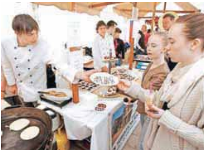
Odlično so se odrezali tudi dijaki Srednje gostinske in turistične šole Radovljica.

Sodelovale so slovenske čokoladnice: Berryshka, Bijolada, Čokoladnica Cukrček, Čokoladnica Da Ponte, Čokoladnica La Chocolate, Čokoladnica Rajskaptica, Čokoladnica Tramontana, Čokoladni atelje Dobnik, Gorenjka, Hiša trt, vina in čokolade Kunej, Jave – Xocolat; Okusi Slovenije, Lucifer chocolate, Medena kraljica, Mojacokolada.si, Pekarna in čokoladnica Plešec, Passero podeželska čokoladnica, Rustika, Sladkozvočje; in iz tujine Figaro, Jordis, Orion. Ob njihovem boku pa še drugi ponudniki: Društvo ljubiteljev pralinejev, Hiša medu Božnar, Lambergh, Château & Hotel, Nani, PT Resman, d. o. o., Pekarstvo in turizem, SGŠT Radovljica, Slastni dimniki in 18sedem3.