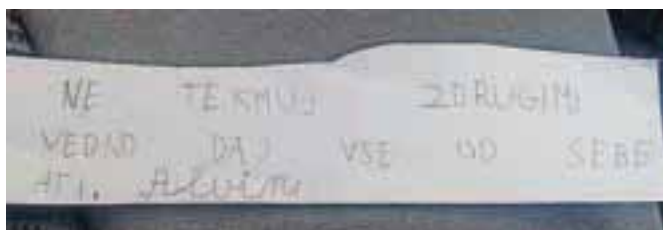
Takole je očeta Edina pred odhodom na tekmovanje spodbujal njegov sedemletni sin Alvin.