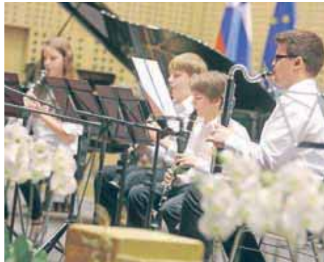
Kvartet klarinetov je poslušalstvo pocrkjal z odlično izvedbo priredbe znane uspešnice Amerika.

Brdo – V začetku aprila je v veliki dvorani na Brdu pri Kranju potekalo jubilejno, 40. srečanje glasbenih šol Gorenjske in zamejstva. Vsaka od petih gorenjskih glasbenih šol (Radovljica, Kranj, Škofja Loka, Jesenice in Tržič) ter obe šoli iz zamejstva (Glasbena matica – šola Tomaž Holmar v Kanalski dolini in Glasbena šola na Koroškem) so pripravile sedem minut koncertnega programa. V glasbeno zelo raznolikem večeru smo slišali soliste, komorne skupine, zbor in ob zaključku tudi Združeni simfonični orkester s skladbo Gorenjski pušelj