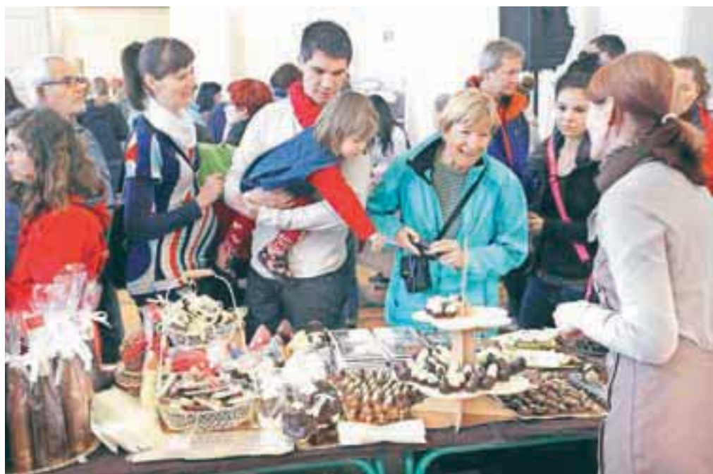
Na vsaki stojnici je bilo nekaj za degustacijo, ki so jo obiskovalci plačevali z degustacijskimi boni; prodali so jih 80 tisoč, kar je še enkrat toliko kot leto poprej.

»Pa četrti festival?« Pomenljiv nasmešek in odgovor: »Bo. Vsako leto je več izkušenj, ki jih je treba upoštevati in uporabiti. Želimo si, da bi festivalski prostor razširili tudi zunaj mestnega jedra in tako mislimo prihodnje leto povabiti tudi čokoladnice iz Avstrije in Italije, kjer je tradicija čokolade trdna in močna.«