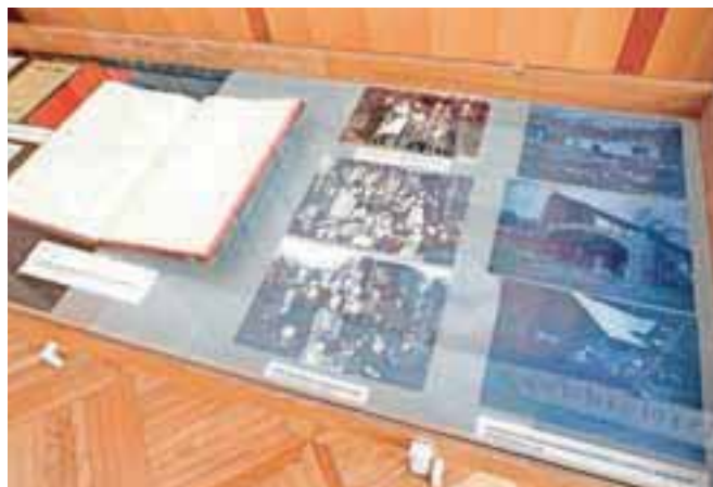
Vitrina je na recepciji Muzejev radovljiške občine od 7. do 20. aprila po urniku odprtosti zbirk. Vitrino je pripravil Mestni muzej na pobudo Toneta Pristova, ki je tudi zbral gradivo.

panja nekaterih gospodarjev, saj so hoteli poiskati sledi in osebe, ki so izvršile ta napad. Prvi ukaz nemških oblasti je bil, da oddvojijo vse gospodarje in jih postrelijo kot talce. Sredi dneva, 4. aprila, pa je iz vojaške komande na Bledu prišel preklc tega ukaza. Zaradi pomanjkanja moške delovne sile v tovarnah in na kmetijah v Nemčiji je bilo ukazano, da se izselijo kompletne družine na Bavarsko v taborišče Rottmanshöhe. Izseljeno je bilo 27 družin, najmlajša izgnanka je bila stara 3 mesece, najstarejši pa kar 85 let. Da bi bila tragedija še večja, pa je na belo nedeljo zagorelo še 23 stanovanjskih hiš in gospodarskih poslopij južno od cerkve,« opisuje tiste strašne čase v, kot pravi, spoštljiv spomin in opomin našim potomcem, da se kaj takega nikoli več ne dogodi.