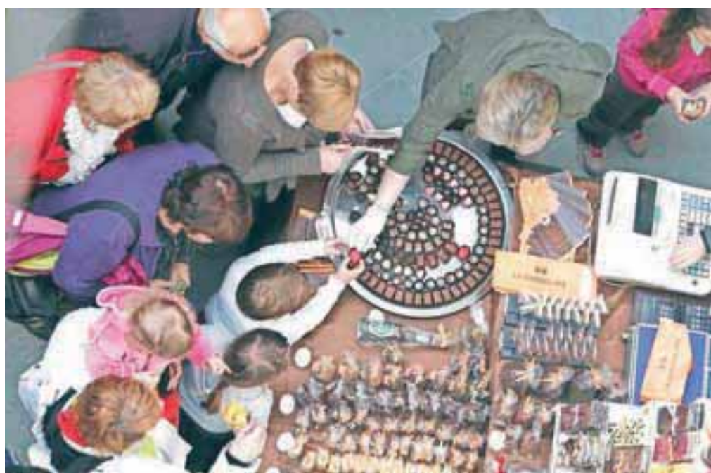
Marsikdo je ostrel, kaj vse je mogoče narediti iz čokolade, od živalskih oblik do zvonikov, od pametnega telefona do izjemno estetskih majhnih bombonjer in pralinejev, od čevljev do velikonočnih košaric s čokoladnimi pirhi in še in še