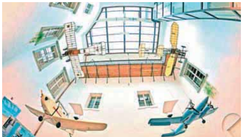
Radovljica 4, avtor Simon Senica (3. nagrada)