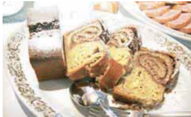
Potica naših korenin je pripravljena iz pšenične in ajdove moke z nadevom iz orehov in hrušk na eni ter skute in sadja na drugi strani.

menoval potica naših korenin. »Priznam, kar precej jajc sem porabil zanjo, to pa zato, da je sama po sebi sočna in da ostane čim dlje sveža, saj je pripravljena popolnoma brez konzervansov.«