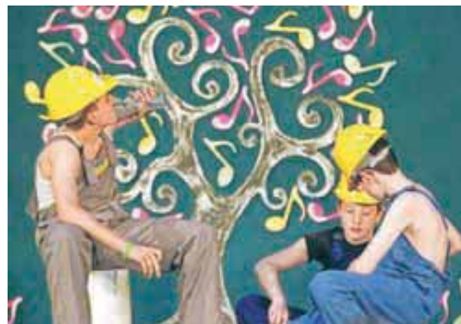
Veliko navdušenja je požela tudi predstava šolskega gledališča z naslovom Vse, razen hotela.

Avla osnovne šole A. T. Linhartarja je bila premajhna za vse, ki so se želeli udeležiti dobrodelne prireditve, na kateri so zbirali sredstva za sofinanciranje nakupa nadstandardne šolske opreme in pomoč učencem iz socialno šibkejših družin. V pestrem programu prireditve so nastopali otroci, učitelji in starši, ki so na ta način skušali zbrati čim več denarja za šolski sklad. S sredstvi iz šolskega sklada so v osnovni šoli A. T. Linhartarja doslej že pomagali številnim otrokom pri nakupu šolskih potrebščin in plačilu nadstandardnih dejavnosti, zgradili igrišče za najmlajše šolarje in kolesarnico, letos pa bodo del zbranega denarja namenili tudi nakupu smučarske tekaške opreme.