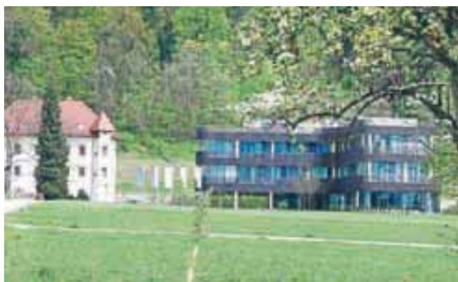
Nekoč Drnča, danes Lambergh