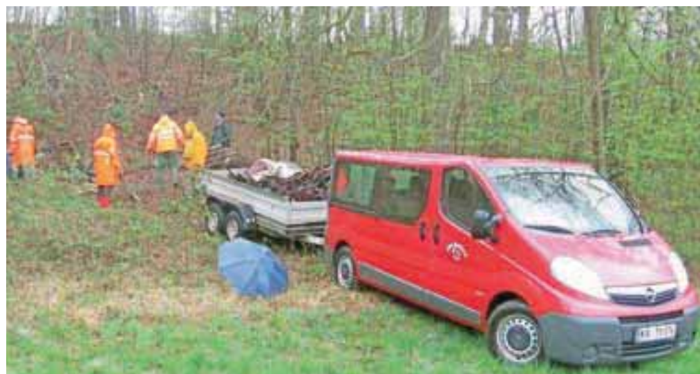
Kljub slabem vremenu in uradno odpovedani akciji je šest članov PGD Hlebce čistilo Brkocovo jamo v Hlebcah, v katero "pridni" vaščani že leta odlagajo smeti. Odpadke so med zbiranjem ločevali in jih dvakrat peljali na zbirni center v Radovljico.

urejena. V vrtcu Lesce so pograbili listje, pobrali kamenje in smeti; akcije se je udeležilo 130 otrok. Čistilno akcijo so v radovljiškem vrtcu izvedli v dveh delih: "Najprej so čistili otroci drugega starostnega obdobja, in sicer 160 otrok skupaj z vzgojiteljicami. Očistili in pograbili smo igrišče, pobrali suho listje, storže in veje ter kamenčke. Nato smo se odpravili še po okolici vrtca, kamor hodimo na sprehode, in pobrali papirčke. Naslednji dan so čistili otroci prvega starostnega obdobja, sedemdeset otrok skupaj z vzgojiteljicami in starimi