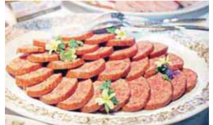
Pripravili so tudi radovljiško verzijo velikonočnega zajtrka; na mizi so bili poleg šunke, potice, hrena in jajc tudi regrat, klobase in gorenjski želodeček.

GG | IZLET // SKUPAJ NA PRVOMAJSKE POČITNICE